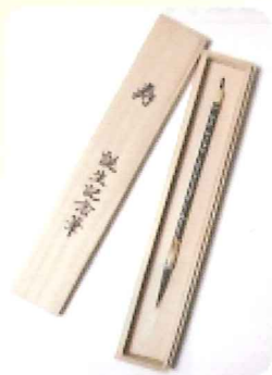
色彩軸・ラクト軸ともに桐箱入

そこで生涯を通じて健やかな成長と、 幸福のお守りとして、 誕生記念筆(胎毛筆)が作られます。